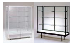
中古・アウトレット